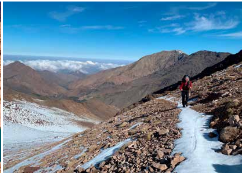
Op weg naar de Likmentpas.