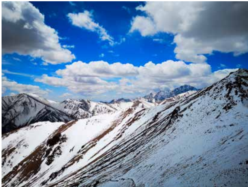
Op de Likmentpas.