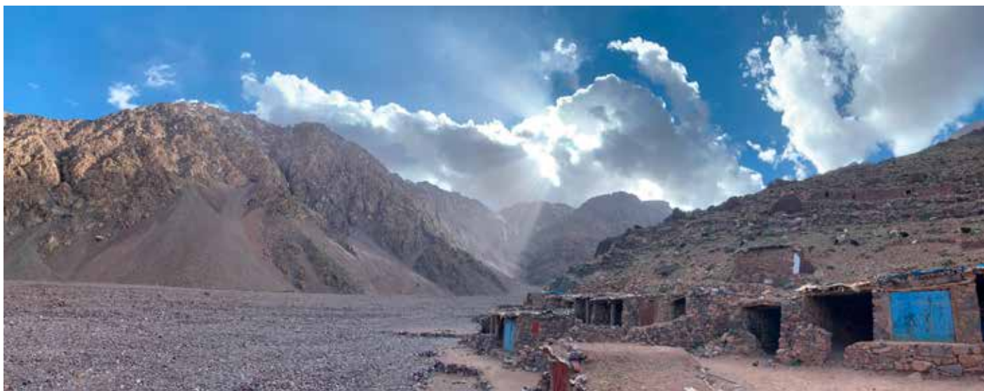
Lichtspel van zon en wolken bij Ifni.

Een uurtje later beginnen we aan een langgerekte afdaling van meer dan 2300 hoogtemeters. Al snel moeten de stijgijzers terug aan om de sneeuwvelden te overbruggen. De eerste honderd meter zijn nog vrij steil, maar nadien is het pure pret in de sneeuw. Vlotjes travereren we richting de Refuge de Toubkal, een berghut van de Franse Alpineclub. De enorme hut en de aanloop naar de top lijkt wel een mierennest. Plots staan we tussen toeristen, ezels,