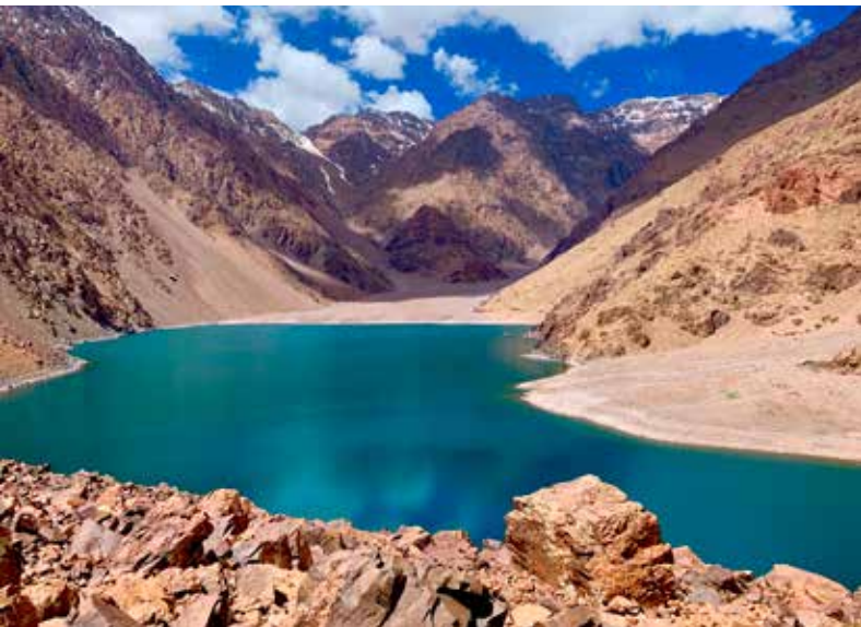
Het Lac Ifni tussen de ontzagwekkende toppen.